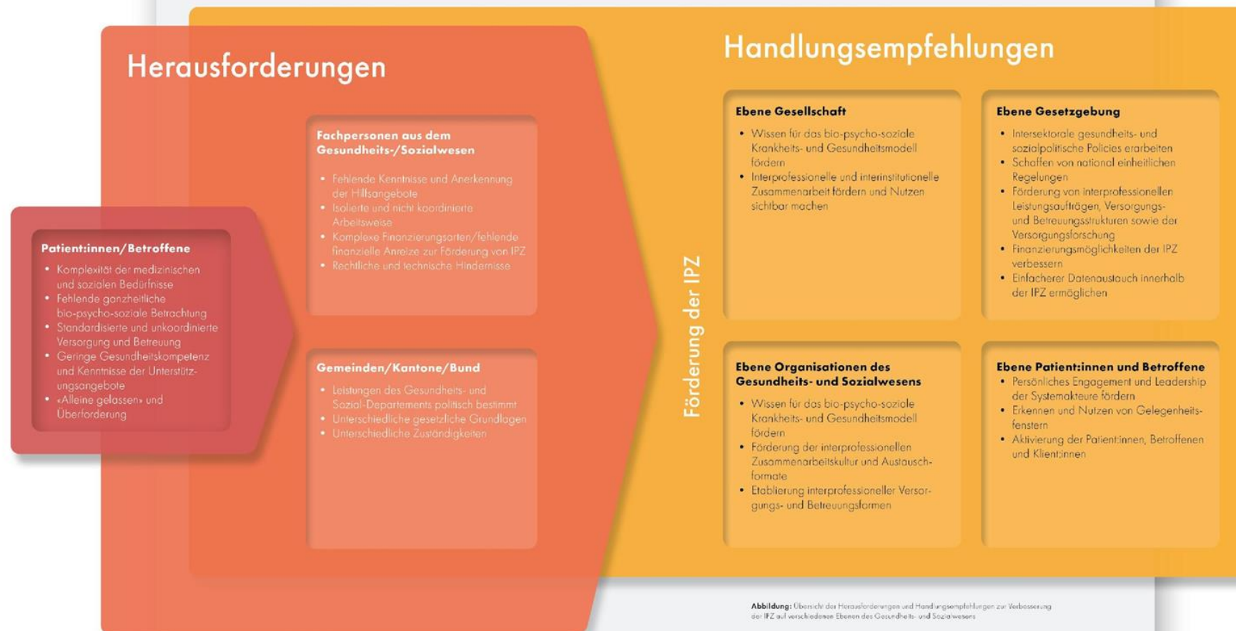
Abbildung: Übersicht der Herausforderungen und Handlungsempfehlungen zur Verbesserung der IPZ auf verschiedenen Ebenen des Gesundheits- und Sozialwesens

fmc Schweizer Forum für Integrierte Versorgung